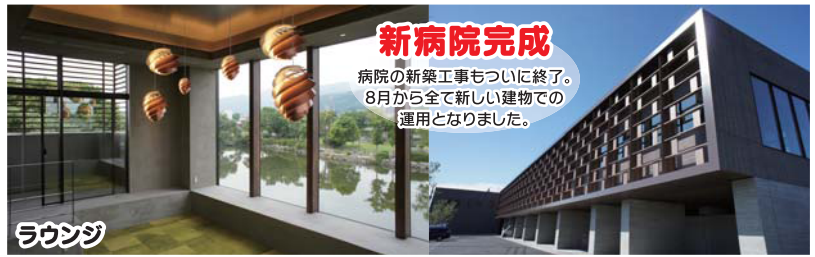
新病院完成 病院の新築工事もついに終了。 8月から全て新しい建物での 運用となりました。